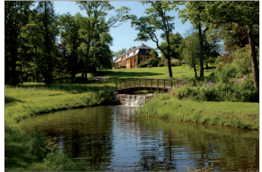
Bogstad, med det store vakre huset i den praktfulle parken, ble anlagt slik vi ser det i dag av Peder Anker. Han førte sine gjester ut i den engelske landskapsparken, med trær og planter innført fra fremmede land.

I 1813 trådte Wedel etter eget ønske ut av offentlig tjeneste og sin stilling som amtmann i Larvik og Buskerud. Politikken hadde også vært en skuffelse. I 1809 hadde han samlet en viss krets rundt seg, men nå sto han mer eller mindre alene i sin tro på en union med Sverige. Det må sies at grevens forestillinger om et folkelig opprør mot kongen og deretter tilslutning til Sverige var svært urealistiske. Det fantes intet grunnlag for dette i en befolkning som både manglet politisk bevissthet og også egne norske ledere, og som gjennom flere hundre år var blitt vant til å bli styrt fra København.