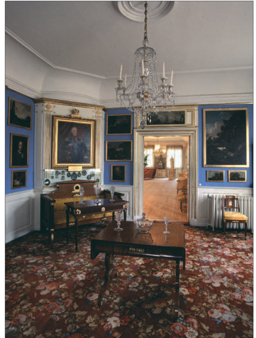
Her vises Blåkabinettet med bilde av kong Carl XIII, svensk-norsk unionskonge 1814–1818. Portrettet er gitt fra kongen til statsminister Peder Anker.

Den som ble innsatt som konge i Sverige var den gamle og barnløse hertug Carl av Södermanland. Siden kongen var barnløs, måtte det velges