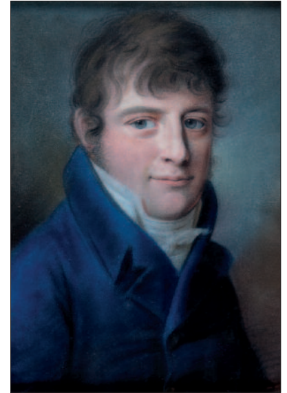
Grev Herman Wedel Jarlsberg malt i 1805. Tilh. Bogstad.