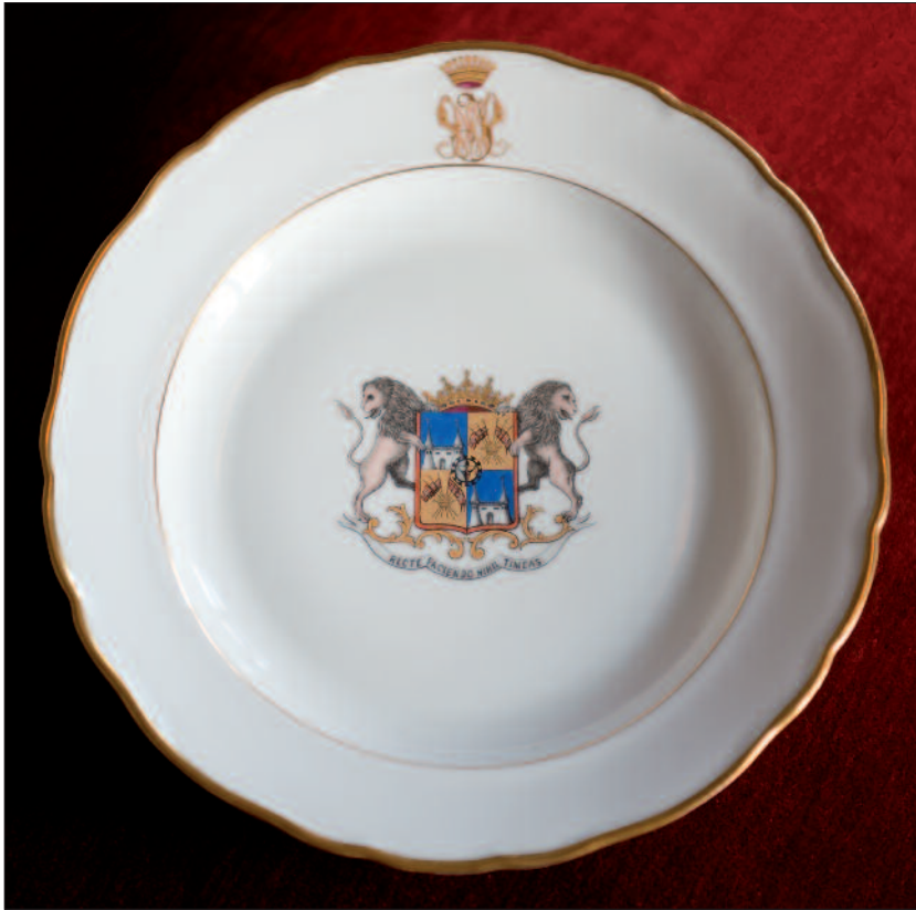
Porselenstallerken med slekten Wedel Jarlsbergs adelige våpen.