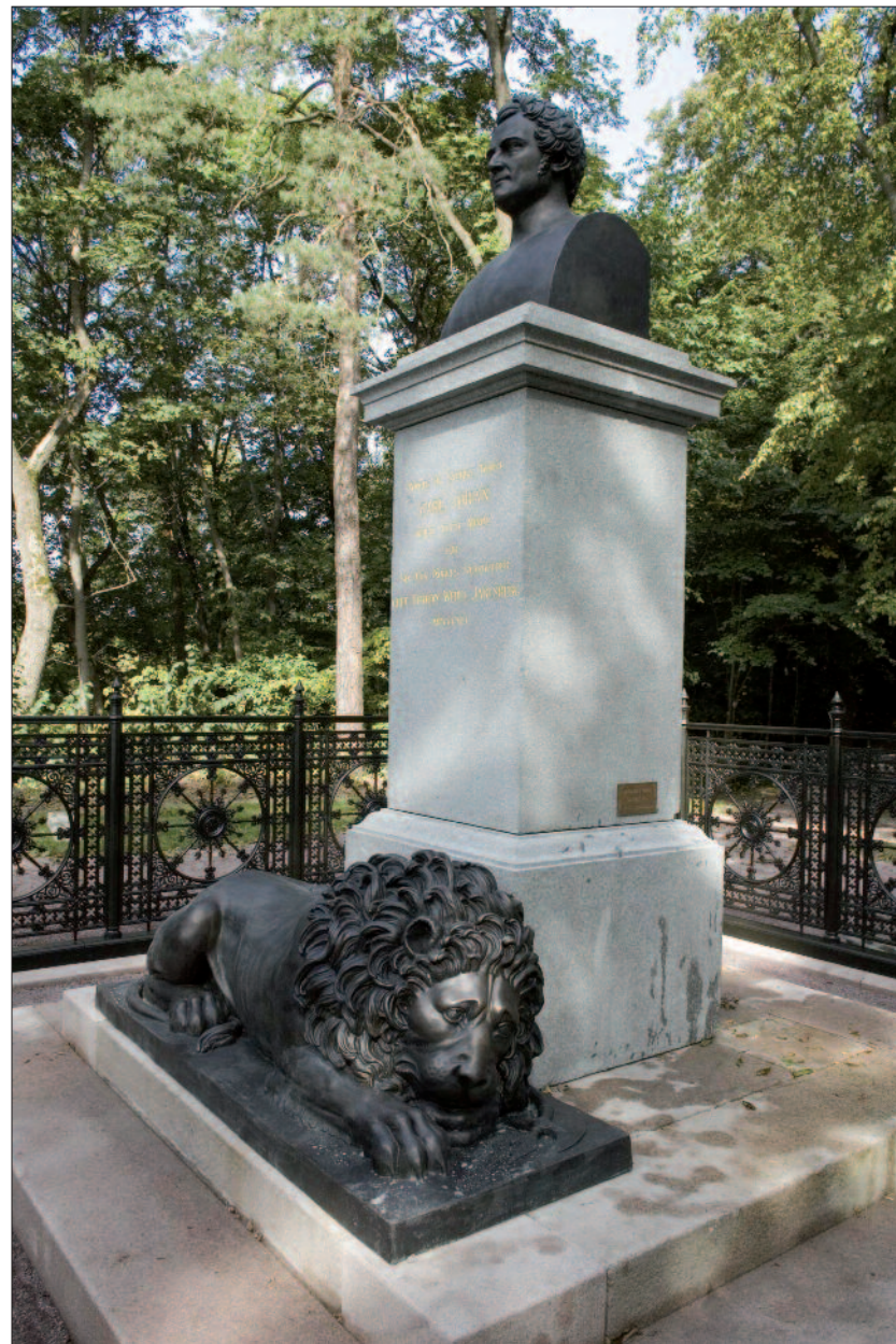
I 1844, fire år etter Wedels død, reiste kong Carl Johan en minnestøtte på Bygdøy, med innskriften «Norges og Sveriges konge Carl Johan reiste dette minde for sin ven Norges Statholder Grev Herman Wedel Jarlsberg». Fra Kongsgården ser kongen mot greven, som fra Dronningberget retter blikket mot Kongsgården.

Herman Wedel hadde hele livet vært en unorsk nordmann. Han var født i Frankrike, og i all hovedsak oppvokst i Napoli, Haag og London.