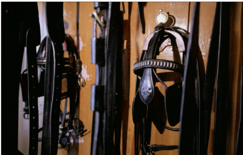
Fra seletøyrommet for herskapshestene på Bogstad. Her er seletøy med dels Peder Ankers våpen på sølvplate, dels grev Herman Wedel Jarlsbergs takkede adelige krone.