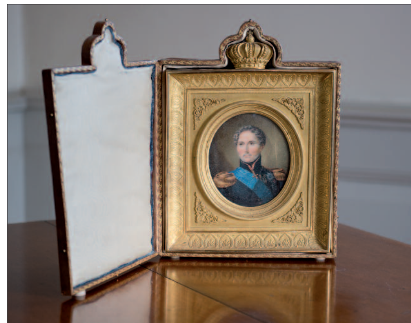
Portrett av kong Carl Johan (1763-1844). Tilh. Bogstad.

Samtidig var kongens mistillit til Wedel på sitt aller høyeste i 1811. Og med god grunn. Den nyvalgte kronprinsen i Sverige, Carl Johan, hadde nå indirekte forbindelser til grupperinger i Norge som var for en union med Sverige. Fremst av alle disse nordmennene var grev Wedel og hans svigerfar Peder Anker og deres nære venn Marcus Gjøre