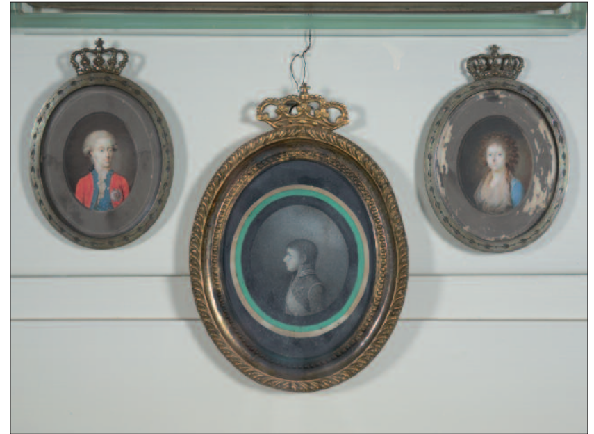
I Blåkabinettet henger miniaturer av personer som er knyttet til Bogstads familie og historie. Her er fra venstre kong Frederik VI av Danmark, stattholder prins Christian August og kongens gemalinne dronning Marie Fredrikke født prinsesse av Hessen. Tilh. Bogstad.