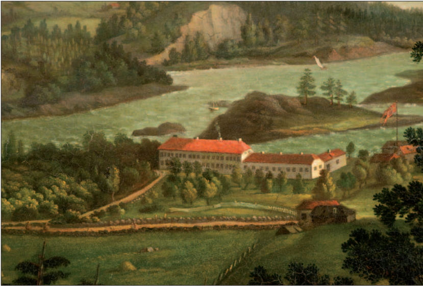
Detalj av maleri av Vækerø, malt 1812-13 av Carl Fr. Vogt i spisestuen på Bogstad. Hovedbygningen der grevparet bodde som nygifte.