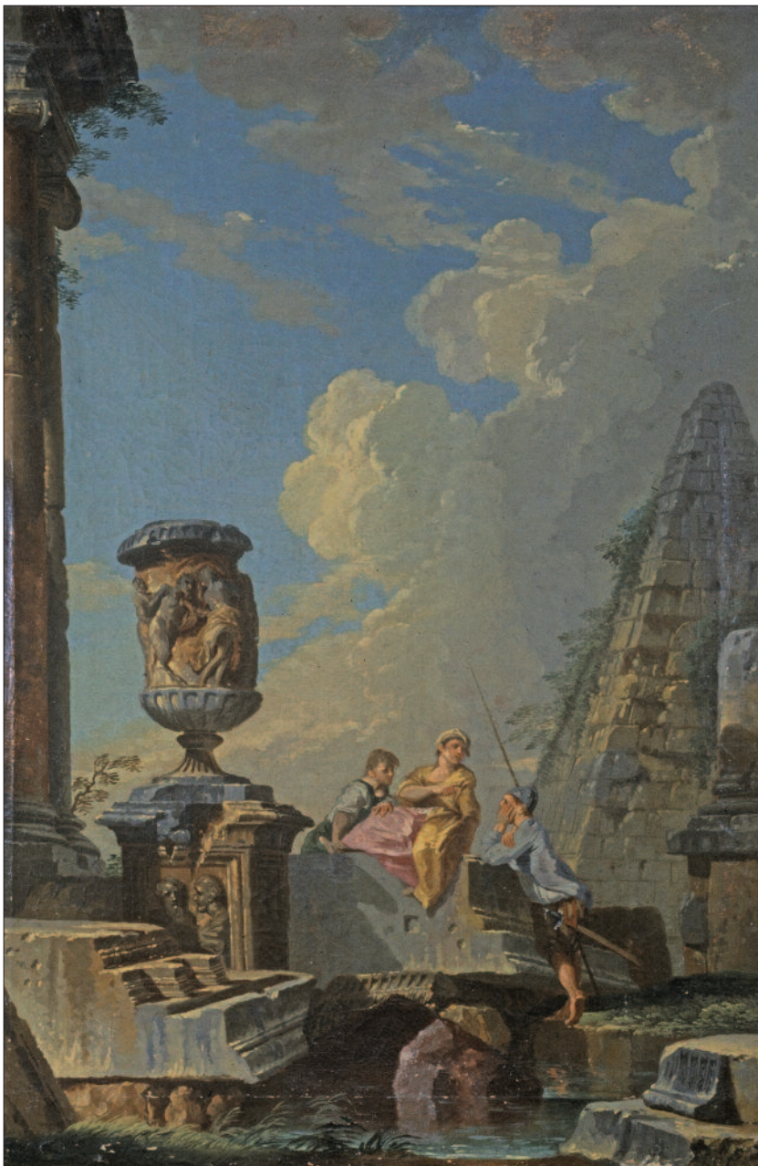
Romerske ruiner, kopi etter Pannini. Maleri i festsalen på Bogstad, i den store samlingen kjøpt av Peder Anker i løpet av hans Grand Tour i Europa på midten av 1700-tallet. Et eksempel på tidens store interesse for antikke motiver.

heten ytterligere at byene i år 79 før vår tidsregning var begravet av den samme vulkanen som fremdeles spydde ut ild og svovel.