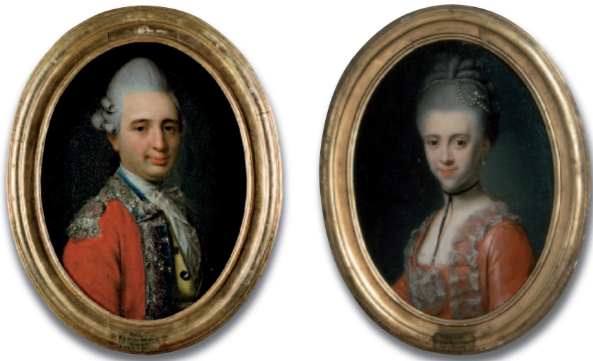
Lensgreve Frederik Anton Wedel Jarlsberg (1748-1811), far til Herman Wedel Jarlsberg. Lensgrevinne Cathrine Wedel Jarlsberg f. Storm (1756-1802), grev Hermanns begavede, liberale og frittalende mor. Malt av Jens Juel antakelig 1772. Privat eie.

hørtes ut på gaten. Det var som han ante tragedien som skulle komme.