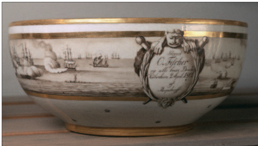
Punsjebolle fra Kongelig Dansk Porcelain, fra en serie laget i 1807 med motiv fra slaget på Københavns red 2. april 1801. Bollen er en gave til grev Wedel for innsatsen under kampene. Tilh. Bogstad.

Didhen staar al min hu! Jeg venter, Naar først er endt min prøvetid, Og Nornen mig til Norge henter, At ofre for mit land hver daad, hver id!